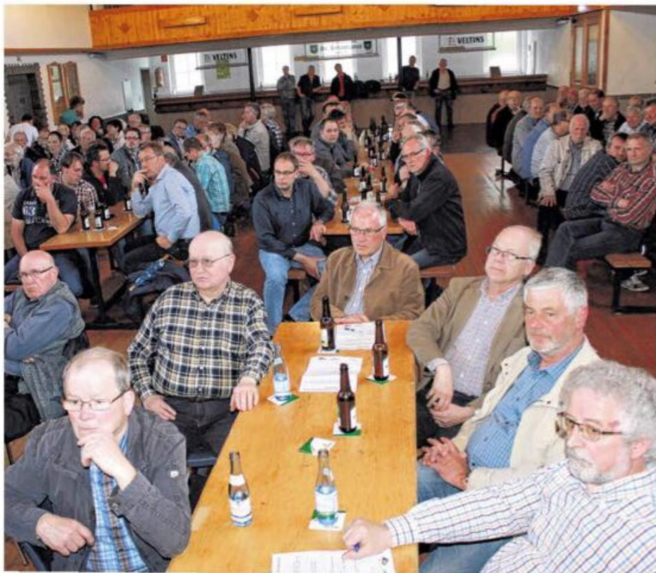
Einwohnerversammlung in Schönholthausen. Ein Schwerpunkt: Windenergie. In Finnentrop sollen nicht nur die Eigentümer und die Energieversorger von der Windkraft profitieren.

Zuletzt fanden die stets gut besuchten Einwohnerversammlungen in Schönholthausen am 06. Mai 2015 und in Serkenrode am 11. Mai 2015 statt.